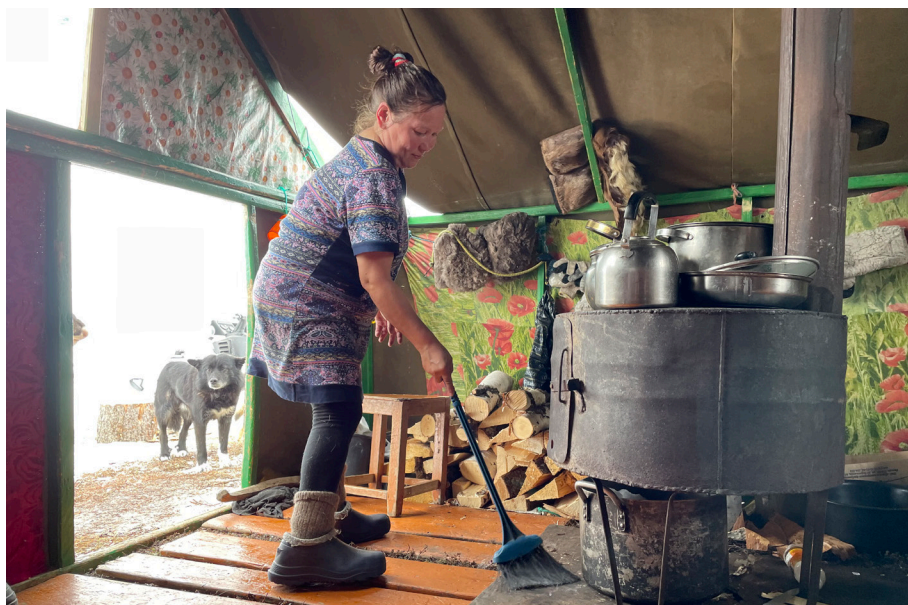
Рис. 3. В палатке. 5-я бригада СПХК «Ненецкая община “Канин”». Канинская тундра. 2023 г.