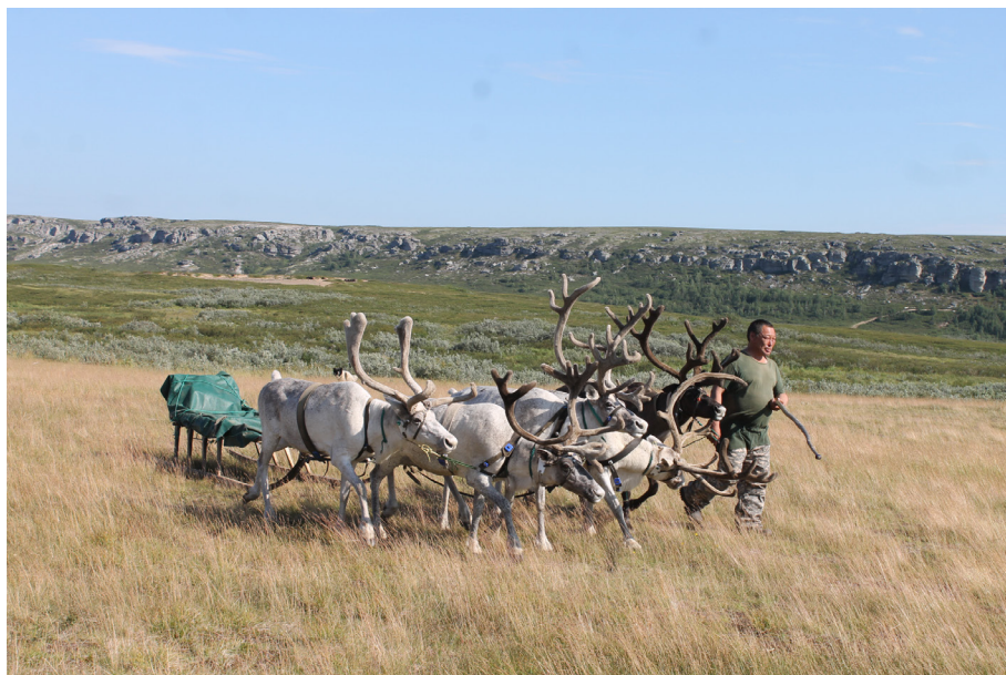
Рис. 5. На смену в стадо. СПК «Индига». Тиманский кряж.