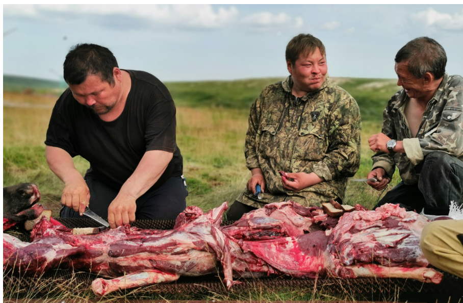
Рис. 6. Трапеза оленеводов. 1-я бригада СПК «Индига». Тиманская тундра. Фото Т. С. Киссер, 2023 г.