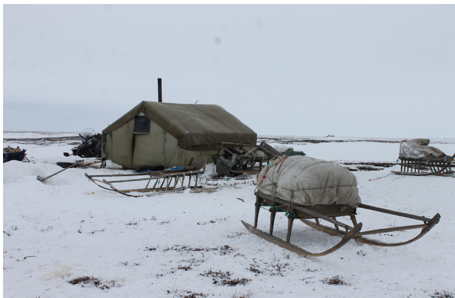
Рис. 2. Палатка канинских кочевников. 5-я бригада СПХК «Ненецкая община “Канин”». Канинская тундра.