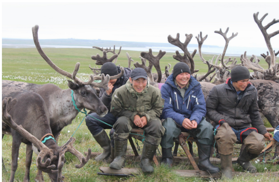
Рис. 7. Молодые оленеводы. Община «Ямб То». Большеземельская тундра. Фото Е. В. Переваловой, 2023 г.