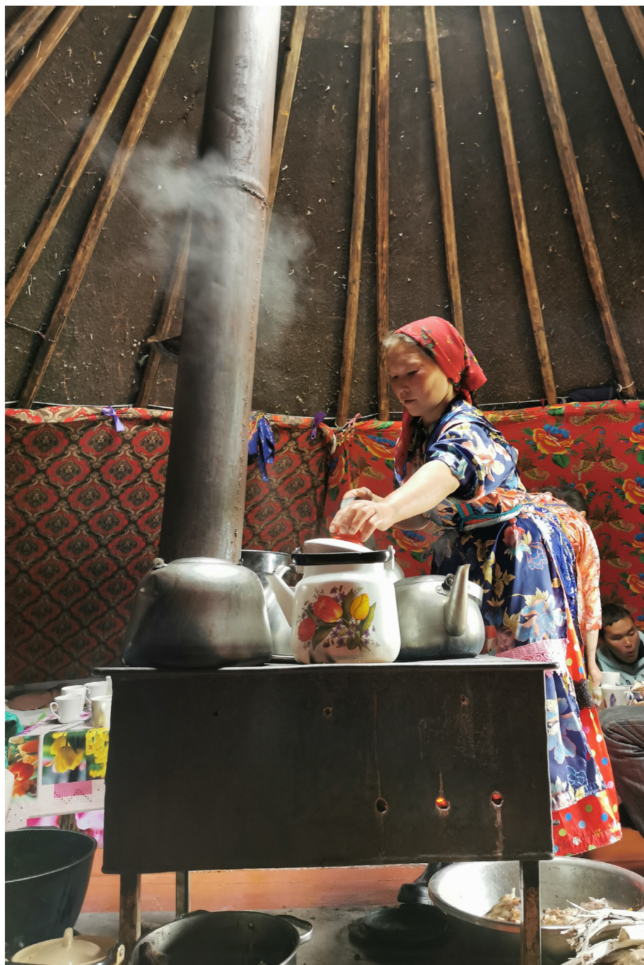
Рис. 10. В чуме. Община «Ямб То». Большеземельская тундра. Фото Т. С. Киссер, 2023 г.