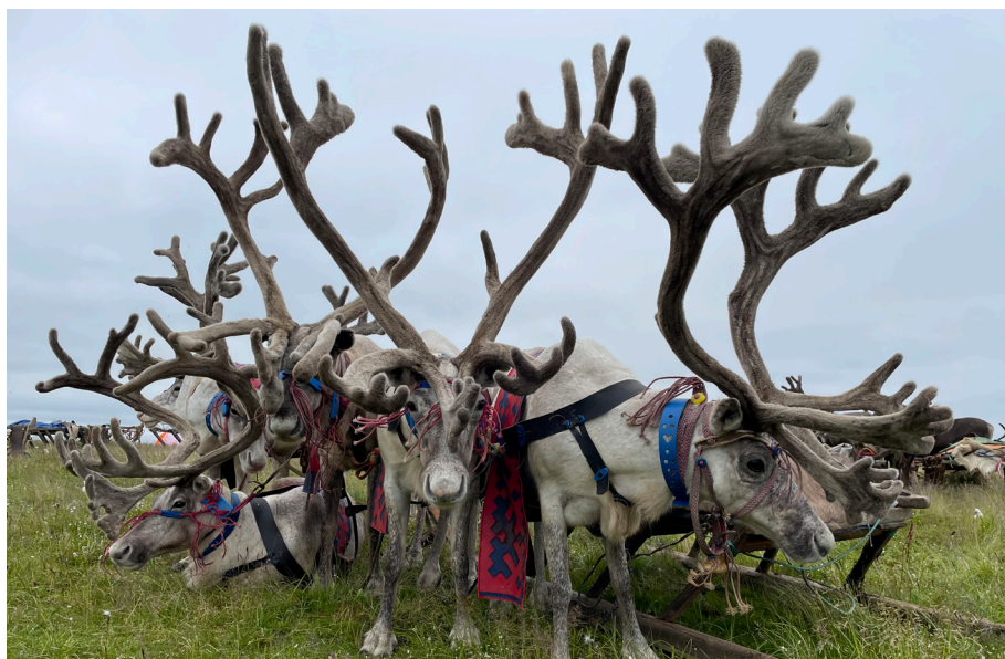
Рис. 9. Женская упряжка. Община «Ямб То». Большеземельская тундра.