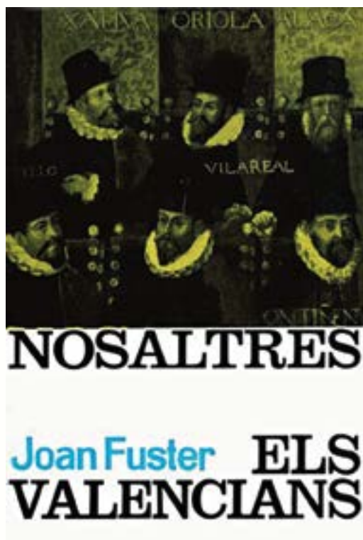
Рис. 2. Книга Ж. Фустера «Мы, валенсийцы».