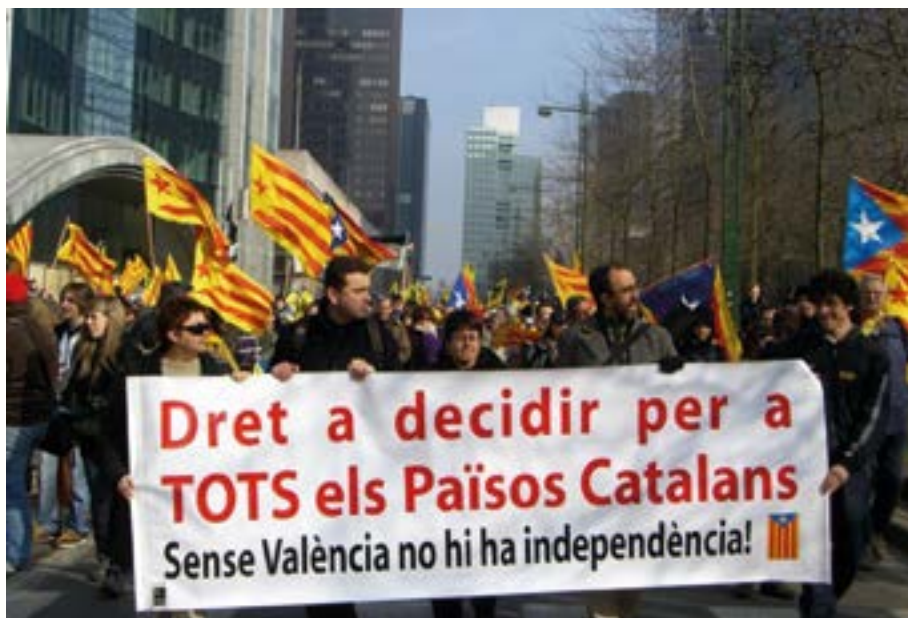
Рис. 3. Панкаталонистская демонстрация под лозунгами «Право решать для всех Каталонских стран!» и «Без Валенсии нет независимости!».