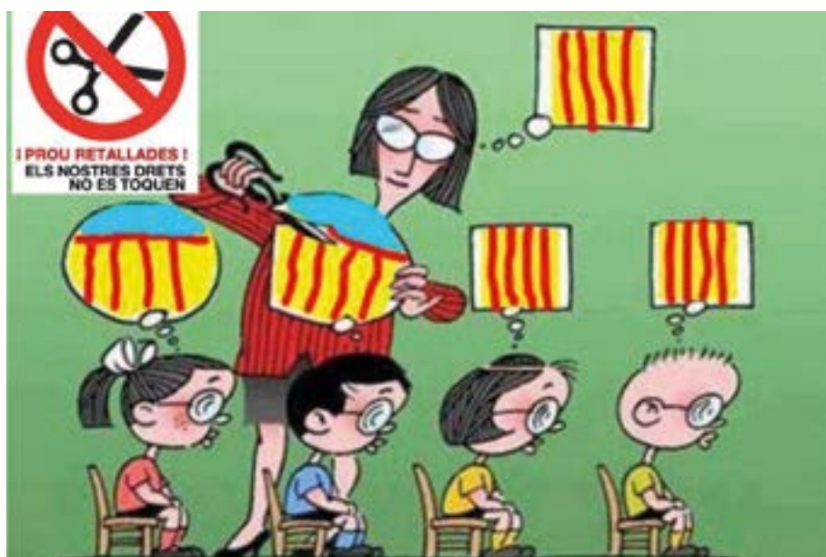
Рис. 7. Блаверистская карикатура на внедрение панкаталонизма через систему образования.