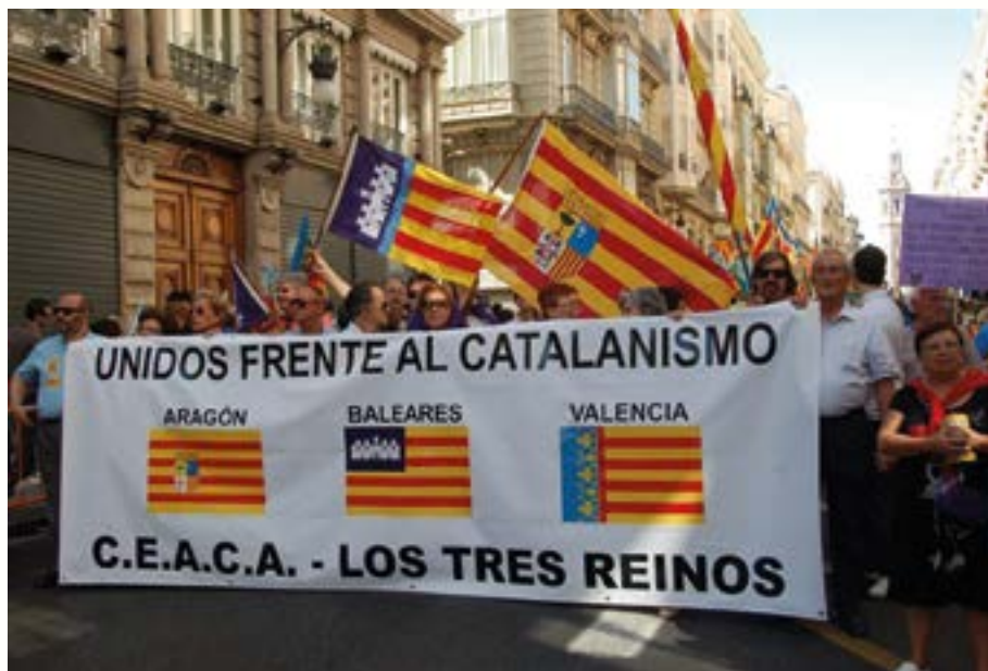
Рис. 4. Манифестация блаверистов с символами Валенсии, Арагона и Балеарских о-вов под лозунгом «Едины против каталанизма».